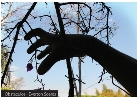
Obstáculos - Everton Soares