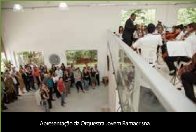
Apresentação da Orquestra Jovem Ramacrisna