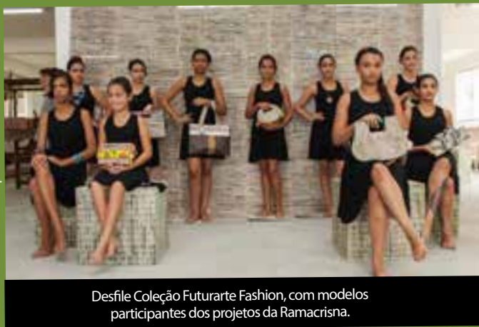
Desfile Coleção Futurarte Fashion, com modelos participantes dos projetos da Ramacrisna.