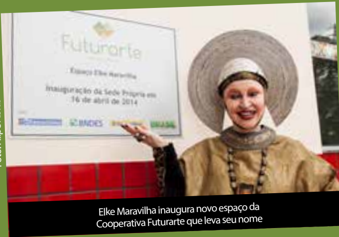
Elke Maravilha inaugura novo espaço da Cooperativa Futurarte que leva seu nome