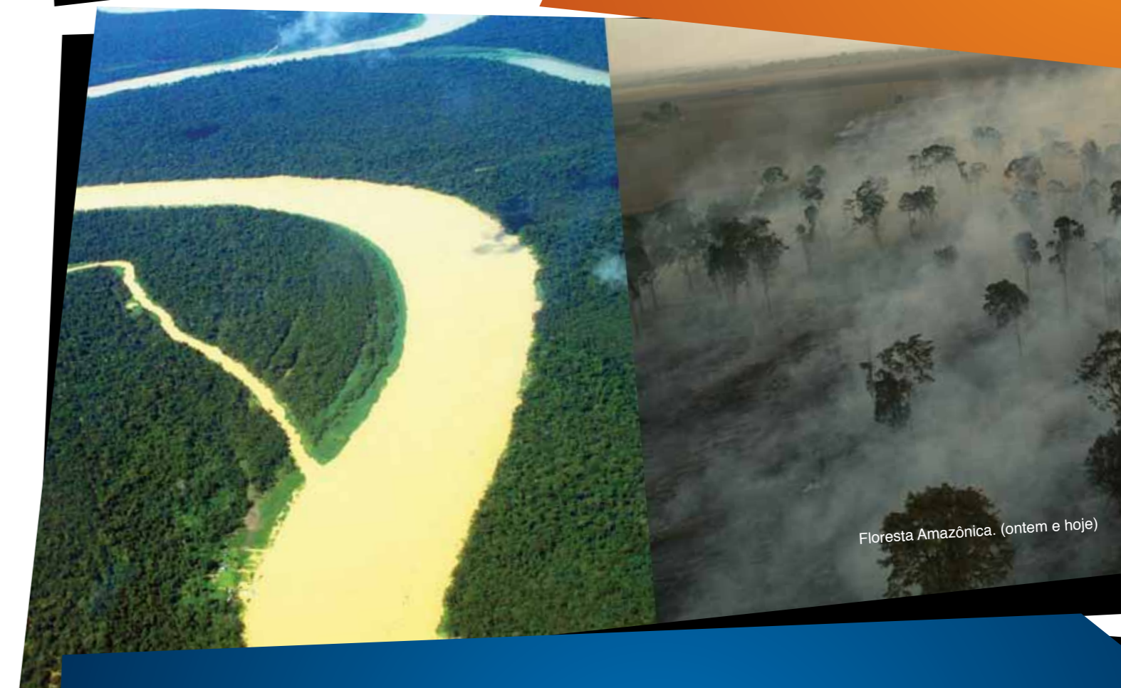
Floresta Amazônica. (ontem e hoje)